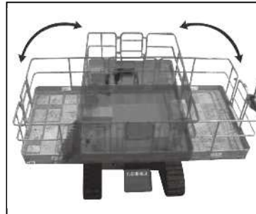
NUZ090D 旋回状況 デッキ180°(左右90°)